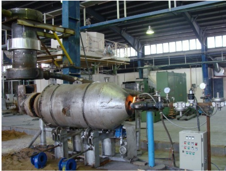
شکل ۳- سیستم سوخت رسانی طراحی و اجرا شده توسط شرکت شعله صنعت برای گازسوز کردن یک کوره دوار ذوب چدن ۵۰۰ کیلوگی در شرکت نوین ستاره کاسپین