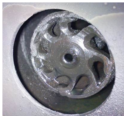
شکل ۲: سرمشعل بکار رفته در مشعلهای مایع سوز مورد استفاده در کوره های دوار ذوب چدن

بزرگترین مشکل سوختهای مایع نظیر گازوئیل و مازوت، افزایش آلایندگی های زیست محیطی می باشد که میزان این آلایندگی ها در مقایسه با گاز طبیعی مقدار قابل ملاحظه ای است. در گذشته با توجه به پایین بودن قیمت گازوئیل و مازوت نسبت به گاز طبیعی، این صنایع تمایلی به گاز سوز نمودن و تغییر سیستم سوخت رسانی خود نداشتند.