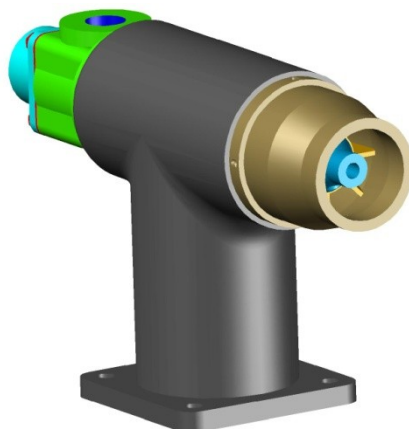
شکل ۶- مشعل طراحی شده در شرکت شعله صنعت برای کوره دوار ذوب چدن

در کوره های دوار ذوب چدن، بخش قابل ملاحظه ای از انرژی حرارتی از طریق محصولات احتراق که دمایی حدود ۱۳۰۰ درجه سانتیگراد دارند، از کوره خارج می شوند. چنانچه مبدل مناسبی در خروجی کوره نصب گردد (رکوپراتور) تا بتوان در این مبدل هوای احتراق را گرم نمود، می توان بخش قابل ملاحظه ای از انرژی حرارتی را به کوره برگرداند یا به عبارت دیگر در اتلاف آن صرفه جویی نمود.