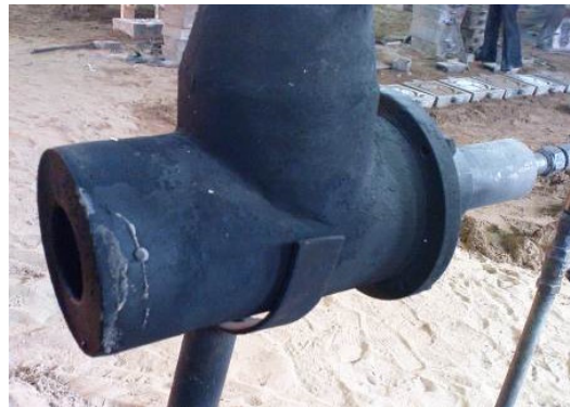
شکل ۱: یک نمونه مشعل گازوئیل سوز مورد استفاده در کوره های دوار ذوب چدن

ضعف عمده مشعل های مازوت سوز یا گازوئیل سوز استفاده شده در کوره های دوار ذوب چدن، کیفیت نامناسب احتراق در این مشعل ها است که عمدتاً ناشی از پودر شدن (atomizing) نامناسب سوخت بدلیل ساختار سنتی و نرسیدن درجه حرارت سوخت به درجه حرارت پودر شدگی و فشار هوای پودر کننده می باشد. در شکل های ۱ و ۲ نمونه ای از مشعل گازوئیل سوز و سر مشعل آن نشان داده شده است. همانطوریکه مشاهده می شود این مشعل ها از کیفیت ساخت مناسبی برخوردار نمی باشند و همین امر منجر به بروز مشکلاتی در کیفیت احتراق این مشعل ها می شود که در ادامه بیان خواهد شد.