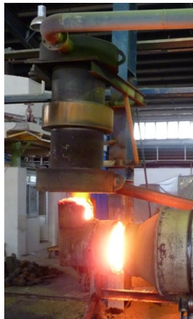
شکل ۴- استفاده از رکوپراتور در بخش انتهایی کوره

همانطور که در بالا عنوان شد، در آزمایش های اولیه مذاب از کیفیت مطلوبی برخوردار بود ولی دمای مذاب به میزان ۳۰ درجه سانتیگراد پایینتر بود. بنابراین از طریق تغییر مشعل به سمت مشعل پیش مخلوط نسبی و با استفاده از قرار دادن رکوپراتور در محل خروجی محصولات احتراق، دمای شعله حدود ۸۰ درجه سانتیگراد افزایش یافت که موجب کاهش زمان ذوب دهی نیز گردید. براساس آزمایشات انجام شده و نتایج بدست آمده، این شرکت توانست علاوه بر جبران کاهش درجه حرارت (حتی با فشار گاز ورودی 70mbar به مشعل)، مذاب مناسب را نیز در مدت زمان دلخواه بدست آورد.