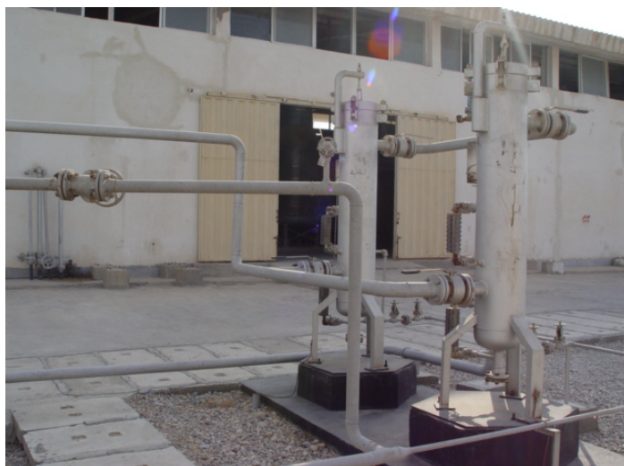
شکل ۲- نمایی از فیلتر کوالیسی توربین های Solar

بمنظور کاهش هزینه های تعمیراتی و راهبری پایدار توربین ها پس از مطالعه منابع دستگاه فیلتر کوالیسی ( شکل ۲ ) و یک دستگاه فیلتر کوالیسی برای توربو کمپرسورهای پروپان ( شکل ۳ ) نصب گردید . کوالیسی های گاز- مایع با راندمان بالا از جنس فایبر گلاس با ساختمان متخلخل در حد چند میکرون ساخته شده اند. ساختمان متخلخل باعث جذب و جدایش ایرسولها می گردند.