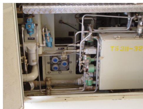
شکل ۱- نمای از سیستم VGF توربین گازی Solar

بمنظور کاهش هزینه های تعمیراتی و راهبری پایدار توربین ها پس از مطالعه منابع دستگاه فیلتر کوالیسی ( شکل ۲ ) و یک دستگاه فیلتر کوالیسی برای توربو کمپرسورهای پروپان ( شکل ۳ ) نصب گردید . کوالیسی های گاز- مایع با راندمان بالا از جنس فایبر گلاس با ساختمان متخلخل در حد چند میکرون ساخته شده اند. ساختمان متخلخل باعث جذب و جدایش ایرسولها می گردند.