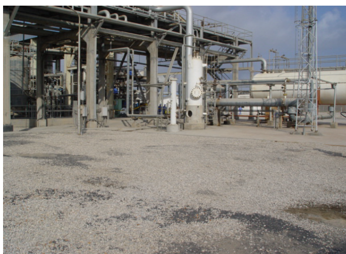
شکل ۳- نمایی از فیلتر کوالیسی توربین های رستون